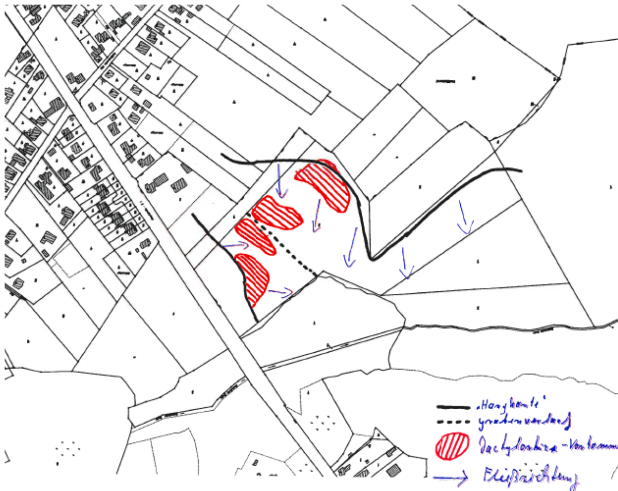
Abbildung 1: Skizze der Orchideenvorkommen und der Geländesituation (instara 2011)

Nach Angaben von instara (2011) ist die Population von Dactylorhiza majalis in 2011 auf ca. 1.400 blühende Exemplare und ca. 250 juvenile, bzw. nicht blühende Pflanzen angewachsen. Bei einer Zählung im Jahr 2006 betrug die Bestandsgröße noch ca. 500 Exemplare (KUNDEL, mdl.). Das Vorkommen kann als eines der größten und individuenstärksten im gesamten Bremer Raum gelten. Im Unterschied zu den meisten anderen Vorkommen ist die Population an diesem Standort sehr vital und wächst.